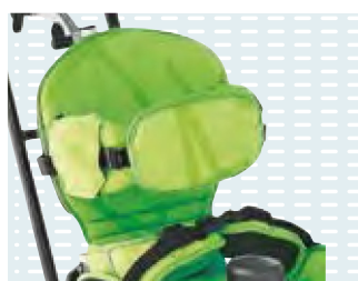
◦ Pelotta frontale