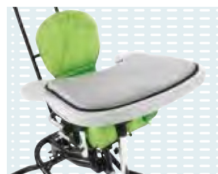
◦ Inserto per tavolino