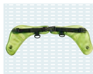
◦ Cintura 4-punti