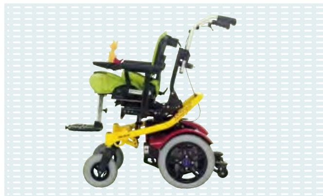
◉ Squiggles Seat con Skippi (optional)