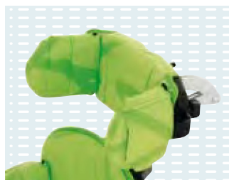
◦ Poggiatesta planare con pelottine laterali