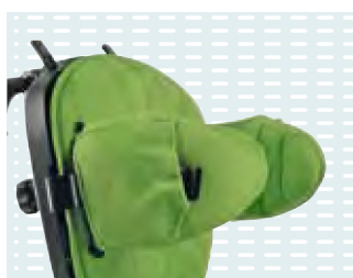
◦ Imbottitura laterale "swing away"