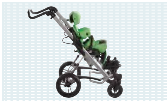
◉ Squiggles Seat con base da esterni Kimba Neo (optional)