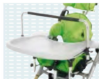
◦ Barretta gioco per tavolino