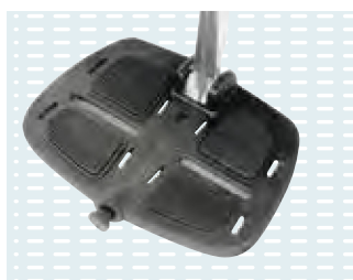
◦ Pedana regolabile