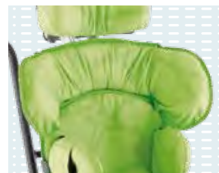
◦ Supporto spalle