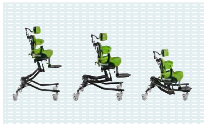
◉ Squiggles Seat con base Hi-Low