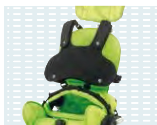
◦ Stabilizzatore pettorale